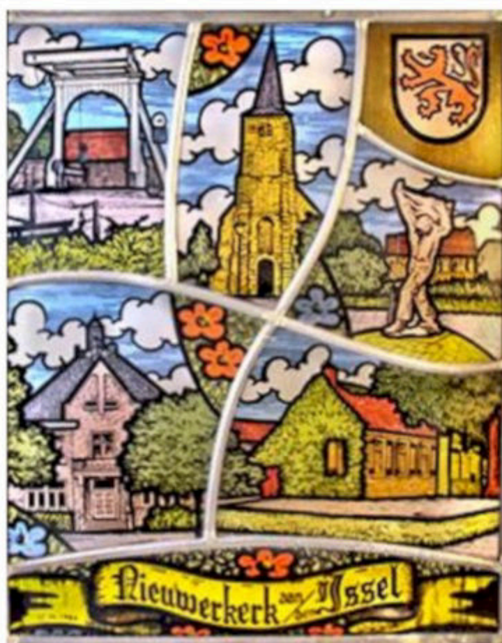
Glas-in-loodraam met kenmerkende afbeeldingen van Nieuwerkerk

Open middagen: eerste zaterdag van de maand van 14.00 - 17.00 uur in de Oudheidkamer