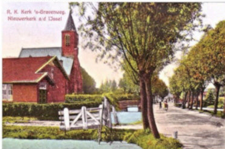
R. K. Kerk 's-Gravenweg. Nieuwerkerke a/d IJssel

Nieuwerkerke viel rond 1890 onder de RK parochie van Moordrecht. Het aantal Nieuwerkerkse Katholieken groeide dusdanig dat het Bisdom het verantwoord achtte om een bijkerk te stichten. De architect Jacobus van Gils bouwde de RK kerk aan de 's-Gravenweg, nummer 89, in de stijl van Cuypers, en deze werd in 1892 in gebruik genomen.